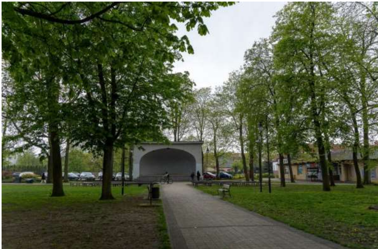
Rysunek 20. Park 1 Maja w Trzciance