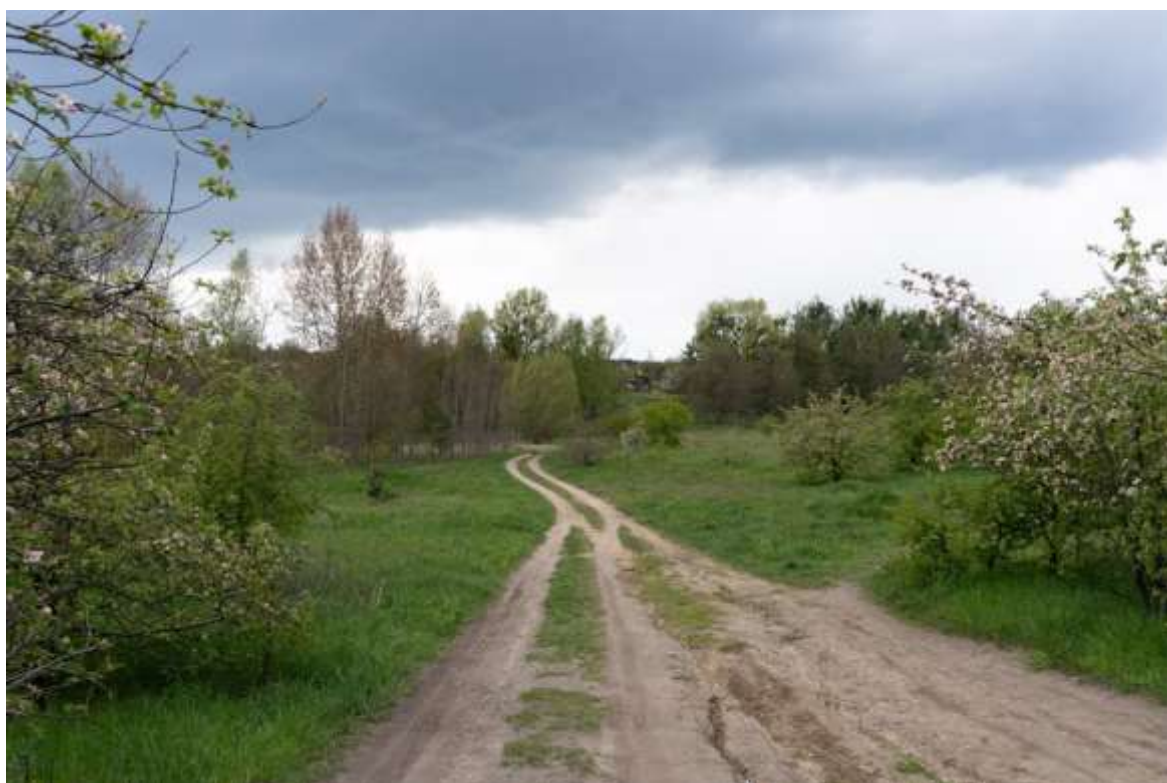
Rysunek 8. Przykład stanu terenu zielonego Dolinki Miłości.

Źródło: materiały z wizji lokalnej przeprowadzonej w dniu 24.04.2024 r.