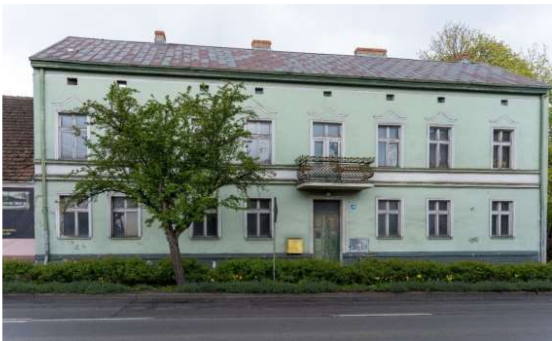
Źródło: materiały z wizji lokalnej przeprowadzonej w dniu 24.04.2024 r.