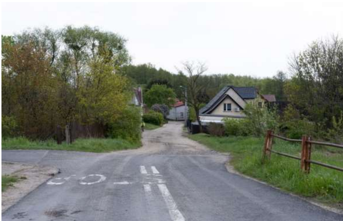
Rysunek 14. Stan techniczny drogi- osiedle Kasprowicza