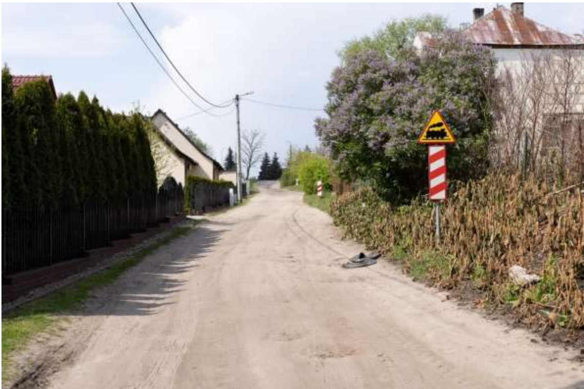
Rysunek 13. Stan techniczny drogi- osiedle Kasprowicza