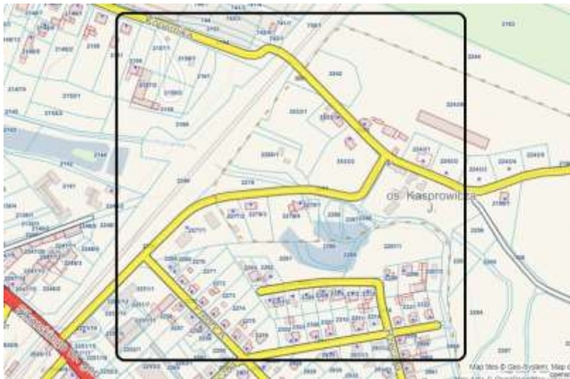
Rysunek 10. Lokalizacja przedsięwzięcia.

Obszar tematyczny przedsięwzięcia: społeczny i przestrzenno-funkcjonalny.