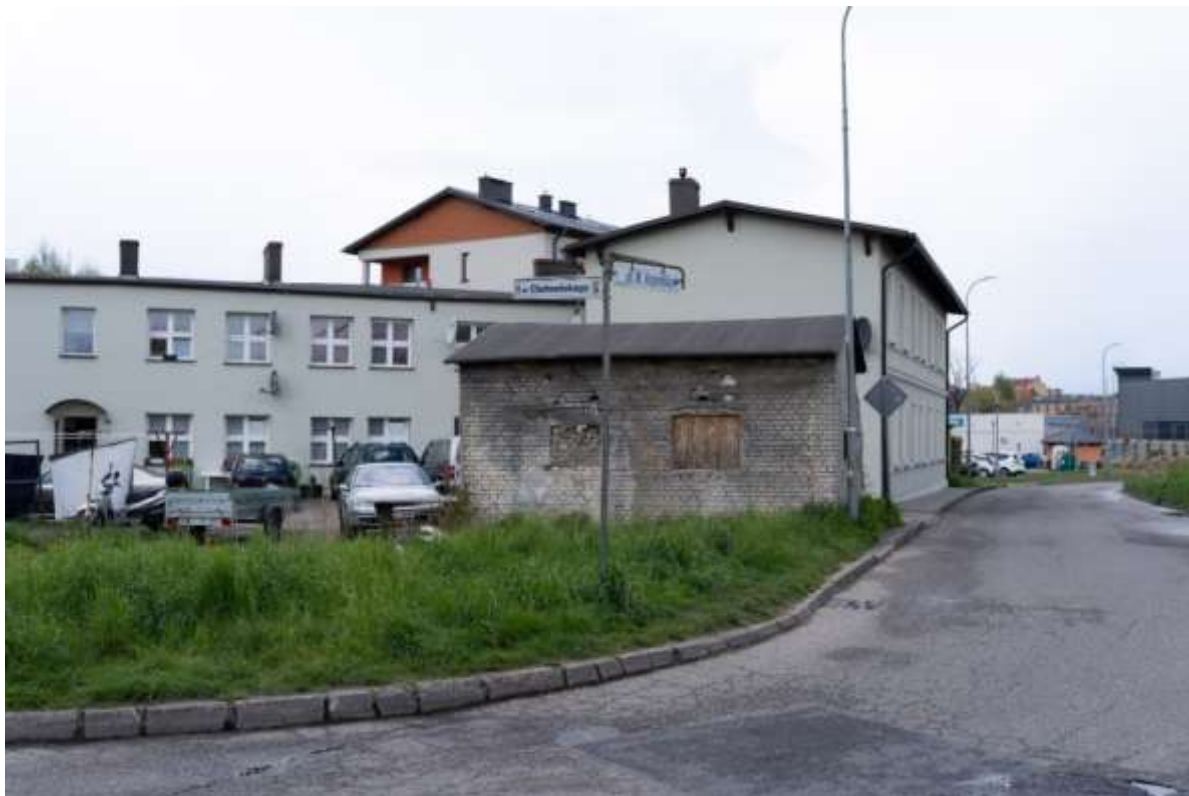
Rysunek 4. Stan techniczny budynku po byłym banku.