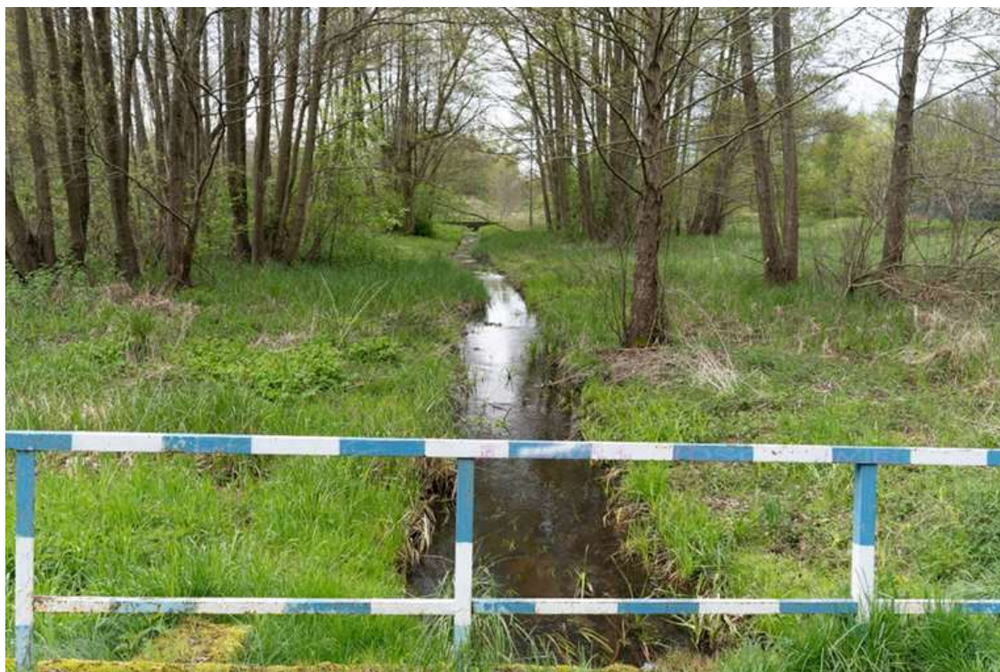
Rysunek 9. Przykład stanu terenu zielonego Dolinki Miłości.