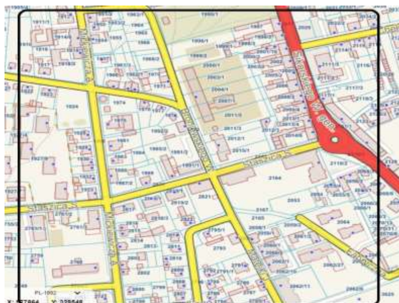
Rysunek 15. Lokalizacja przedsięwzięcia

Teren, na którym będzie realizowane przedsięwzięcie zlokalizowany jest przy ulicach: ul. Sikorskiego, ul. Mickiewicza, ul. Staszica.