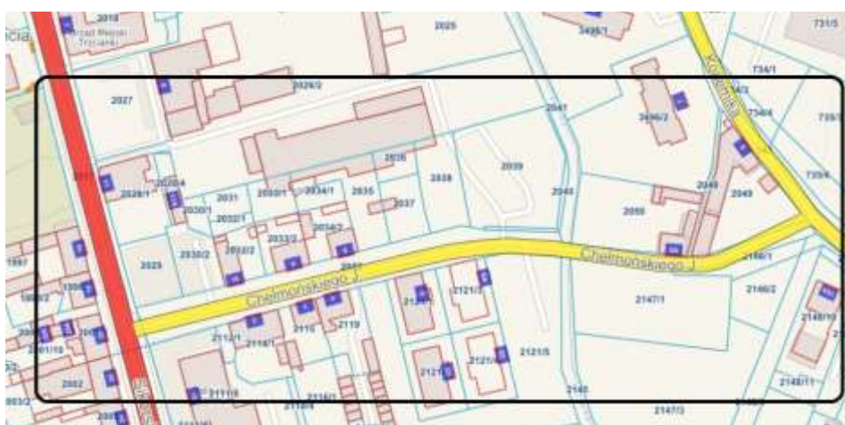
Rysunek 2. Lokalizacja przedsięwzięcia.

Obszar tematyczny przedsięwzięcia: przestrzenno-funkcjonalny.