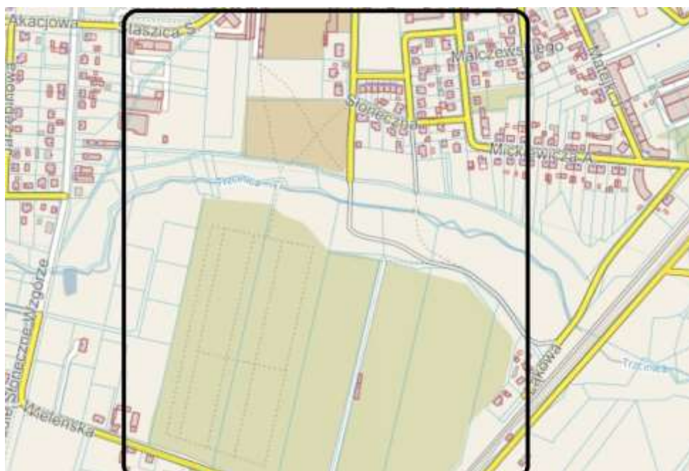
Rysunek 6. Lokalizacja przedsięwzięcia

Obszar tematyczny przedsięwzięcia: środowiskowy.