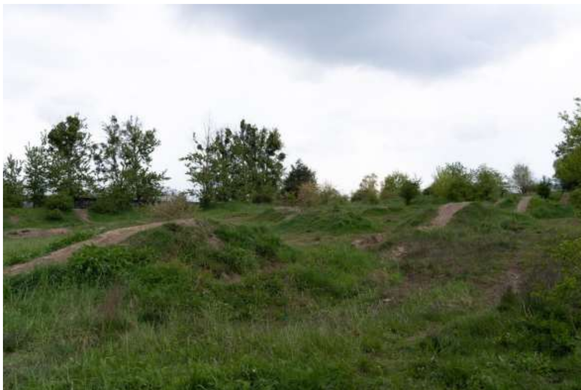
Źródło: materiały z wizji lokalnej przeprowadzonej w dniu 24.04.2024 r.