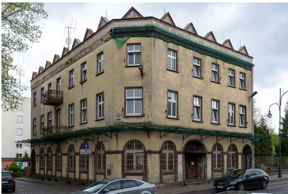
Rysunek 5. Przykład stanu technicznego dróg.