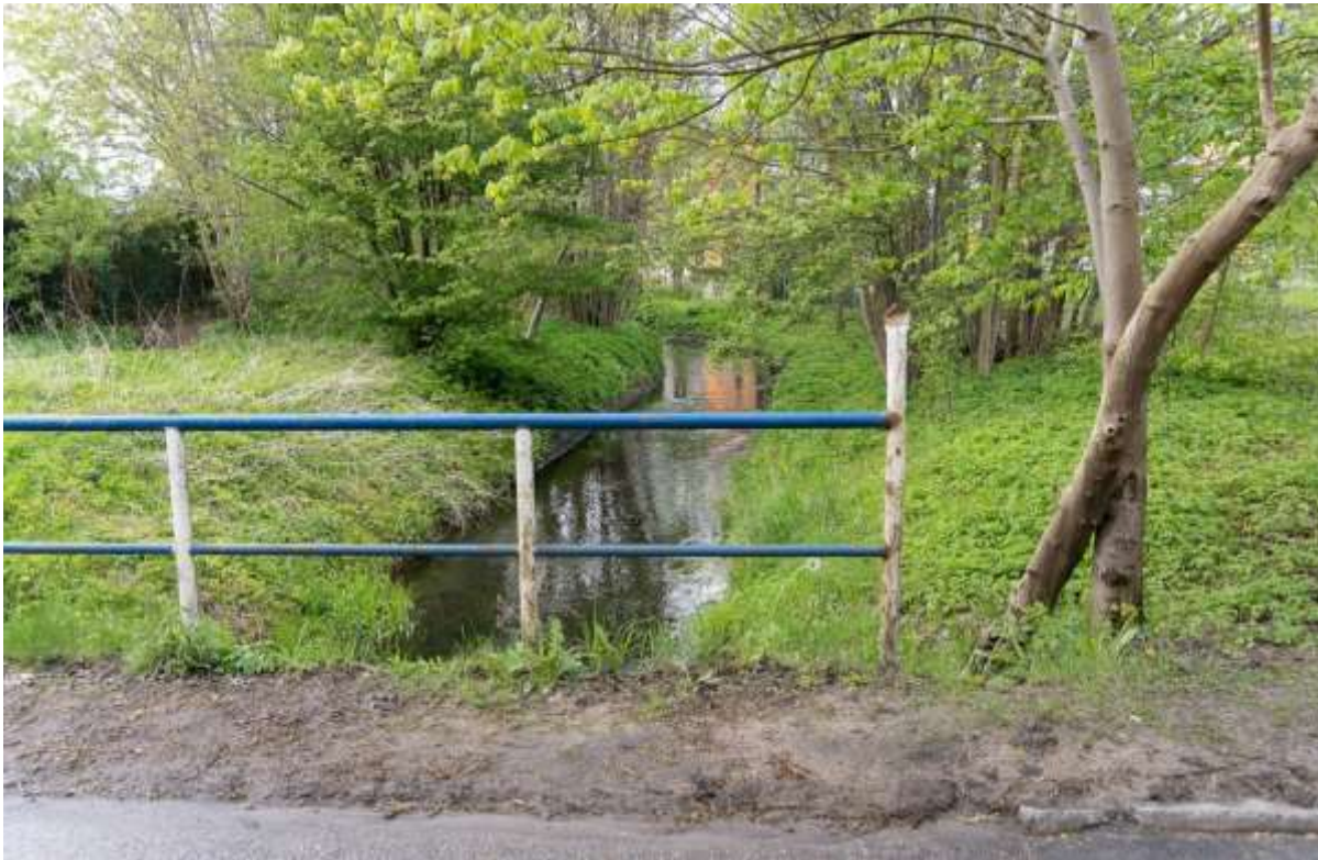
Rysunek 12. Przykład stanu terenu zielonego- osiedle Kasprowicza