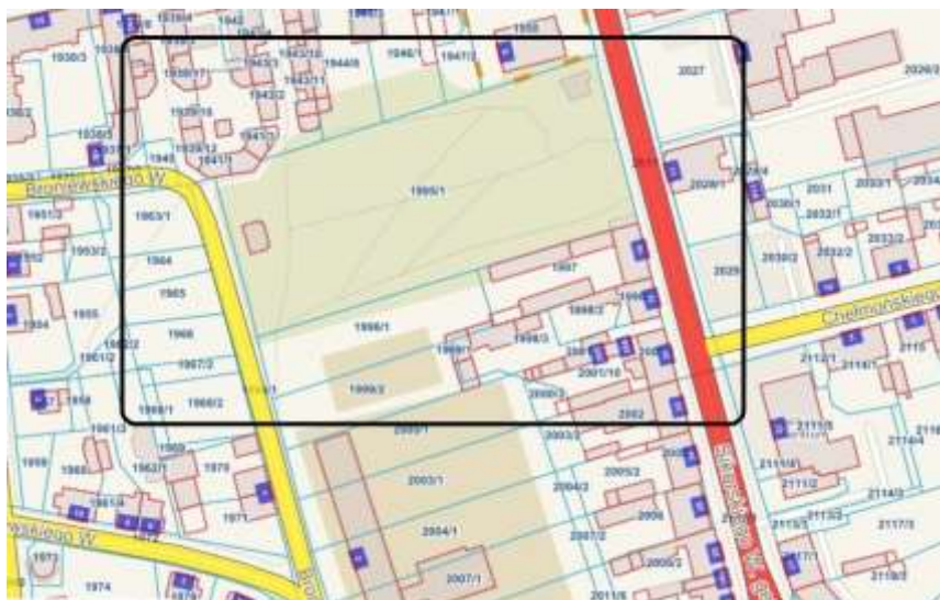
Rysunek 19. Lokalizacja przedsięwzięcia

Obszar tematyczny przedsięwzięcia: społeczny, środowiskowy.