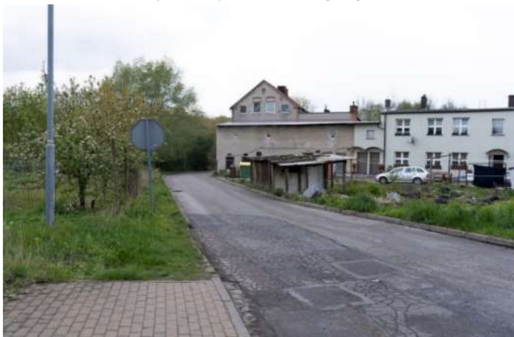
Rysunek 3. Przykład stanu technicznego dróg i terenów zieleni