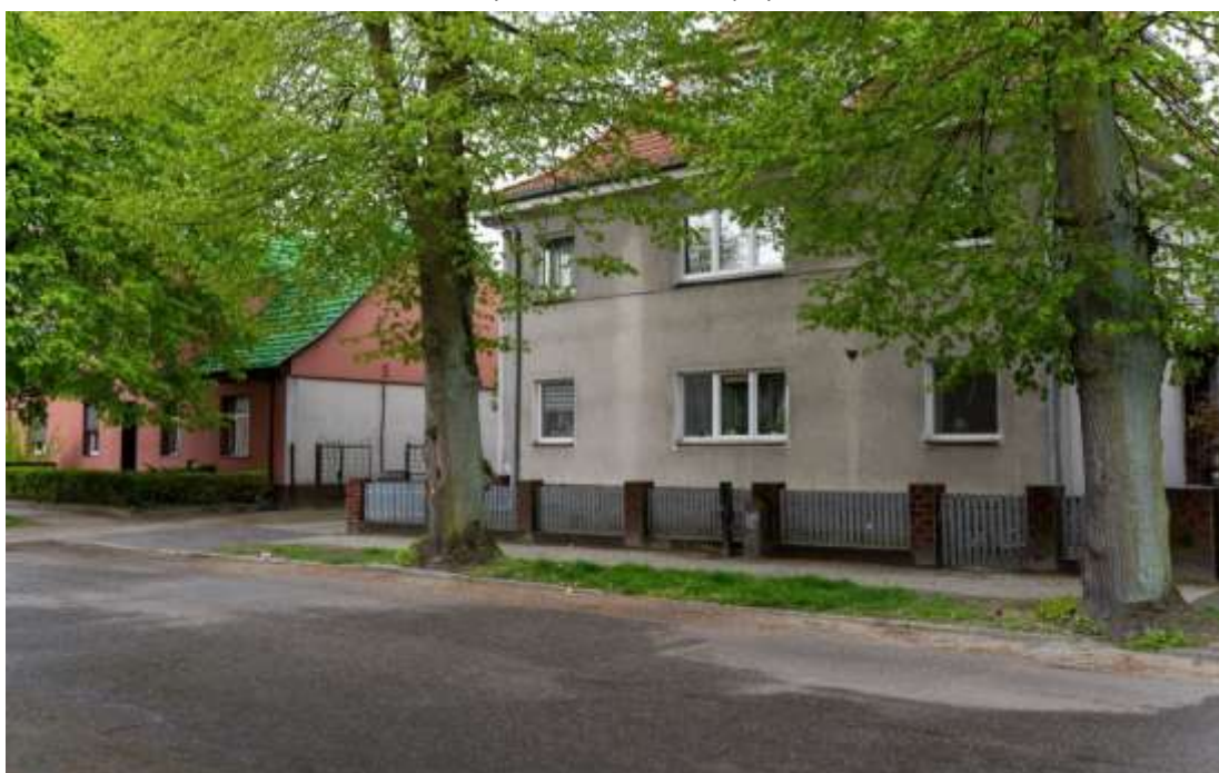
Rysunek 18. Kamienica przy ul. Mickiewicza