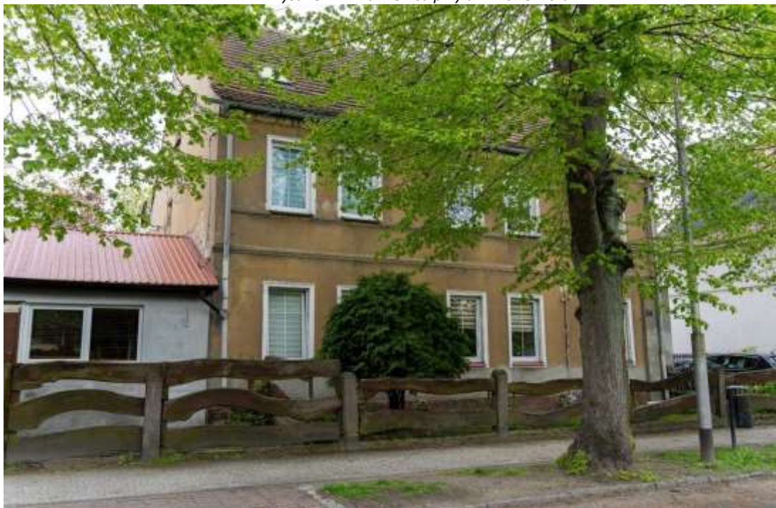
Rysunek 17. Kamienica przy ul. Mickiewicza